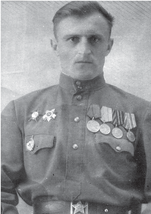
Нестер Исаевич Пашкевич

ной войны и войны с Японией, был командиром стрелковой роты 176-го стрелкового полка в действующей армии Западного фронта; командиром разведэскадрона 32-й дивизии Сталинградского Западного фронта, командиром танковой роты 207-го танкового полка 3-го Белорусского фронта, начальником разведки полка и начальником штаба отдельного дивизиона 2-го Белорусского и 1-го Дальневосточного фронтов.