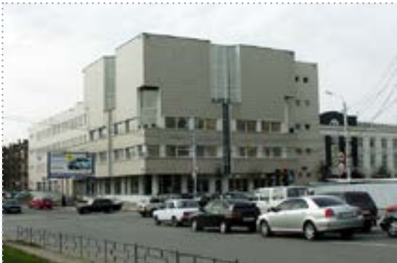
Межрегиональный учебный центр (г. Тула) Университета Банка России

В соответствии с многосторонним Соглашением о сотрудничестве в области обучения персонала Межрегиональный учебный центр (г. Тула) Университета Банка России является основной площадкой, где проводятся международные учебные мероприятия для представителей центральных (национальных) банков — участников Евразийского совета центральных (национальных) банков, стран СНГ, экспертов зарубежных банков и международных финансовых организаций.