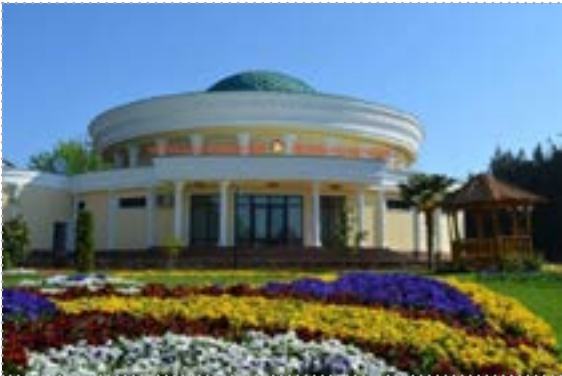
Учебный центр Национального банка Таджикистана (г. Гулистон)

Учебный центр Национального банка Таджикистана создан с целью проведения курсов повышения квалификации для работников банковской системы. При строительстве Учебного центра были учтены все особенности данного направления и созданы необходимые условия для встречи и размещения гостей и проведения различных мероприятий на должном уровне.