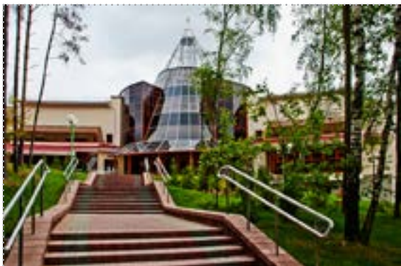
Учебный центр Национального банка Республики Беларусь (д. Раубичи)