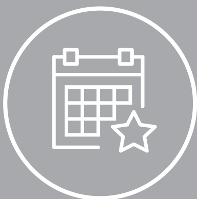
График проведения семинаров