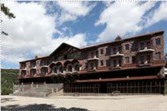
Учебный центр Центрального банка Республики Армения (г. Цахкадзор)

Учебный центр является структурным подразделением Центрального банка Республики Армения.