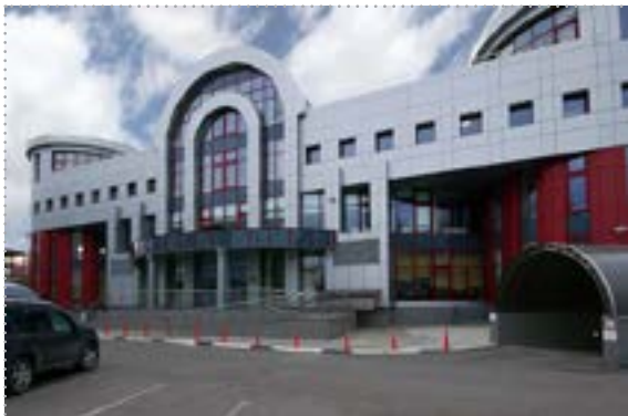
Университет Банка России

Университет Банка России является структурным подразделением центрального аппарата Банка России и располагает двумя площадками: кампус в г. Одинцово и Межрегиональный учебный центр в г. Туле.