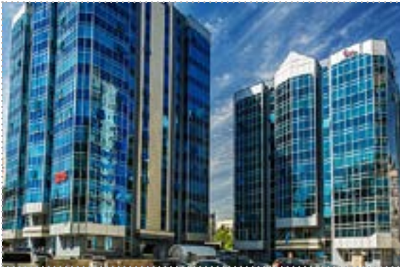
Учебный Центр Национального Банка Республики Казахстан (г. Алматы)

АО «Учебный Центр Национального Банка Республики Казахстан» является дочерней организацией Национального Банка Республики Казахстан, создан после реорганизации АО «Академия регионального финансового центра города Алматы», 27 апреля 2017 года.