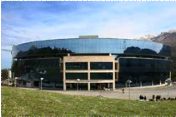
Учебно-исследовательский центр Центрального банка Республики Армения (г. Дилижан)

Учебно-исследовательский центр Центрального банка Республики Армения находится в городе Дилижан, который является горноклиматическим и бальнеологическим курортом, расположенным на высоте 1250-1500 м над уровнем моря в 110 км от Еревана.