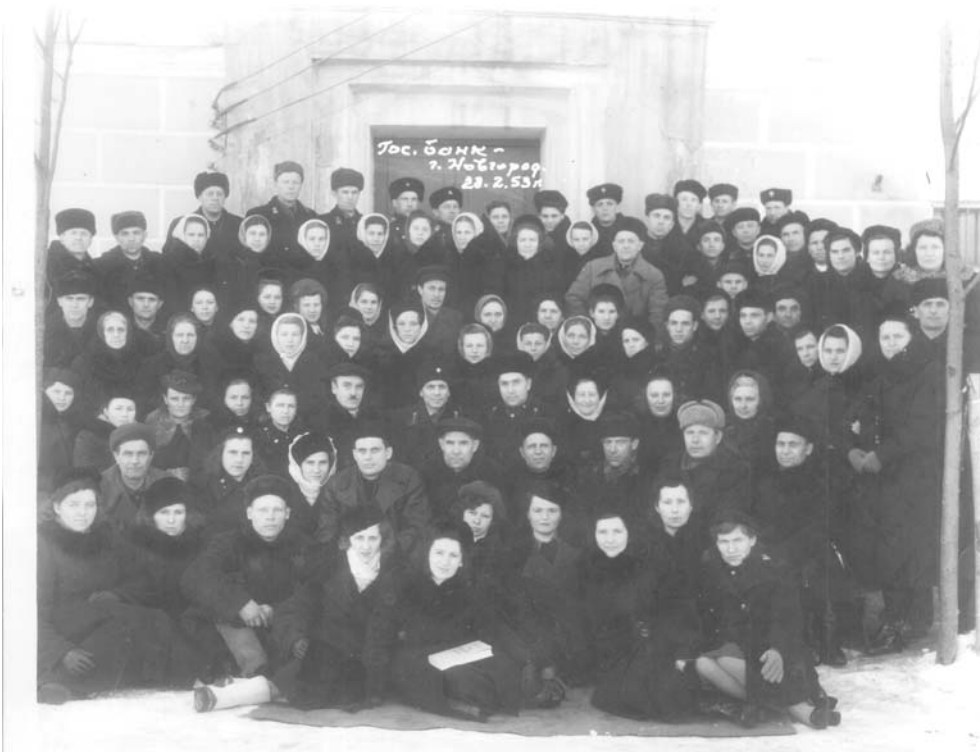
Сотрудники Новгородской областной конторы Госбанка. Фото 1953 г.