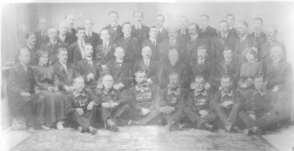
Состав служащих банка на 1905 г.

Необходимость быстрого восстановления разрушенного войной хозяйства области поста-