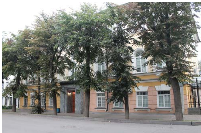
Здание Отделения по Новгородской области