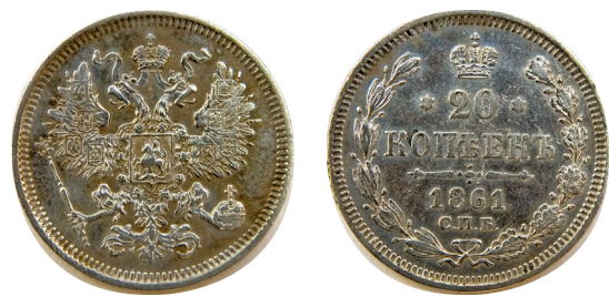
Российская серебряная разменная монета 20 копеек, отчеканенная во Франции в 1861 г. Из Музейно-экспозиционного фонда Банка России

В том же 1861 г. 10, 15 и 20-копеечники по заказу российского правительства чеканили во Франции, на Парижском и Страсбургском монетном дворах (всего их было доставлено в Россию на 9,1 млн руб.). Это стало возможным благодаря сделке с Банком Франции, когда за полтора миллиона золотых полуимпериалов российской чеканки (из запасного фонда государственных кредитных билетов) было куплено французского серебра почти на 31,1 млн франков [24].