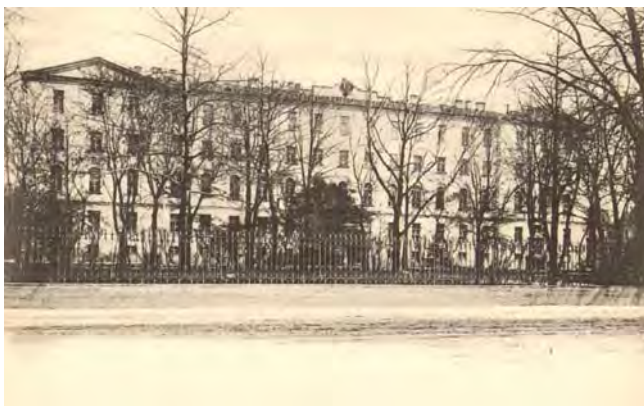
Императорский Александровский лицей

Не первый раз в истории главного банка Государства Российского возникла проблема кадров. С ней