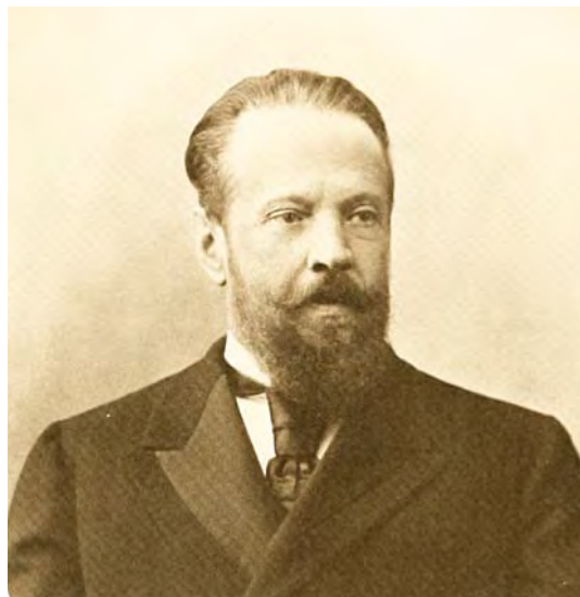
Витте Сергей Юльевич

О недостаточности специалистов высокой квалификации свидетельствует приказ по Народному банку от 25 марта 1918 года по вопросу об эвакуации в Москву личного состава, в котором содержалось: «из имеющегося личного состава в 82 человека для эвакуации выделено 40 человек, которые по своей подготовленности, специальным знаниям и работоспособности нужны для дела и не могут быть заменены в настоящее время, если в вопросе эвакуации не будет доминировать намерение обязательного сохранения всего существующего штата».