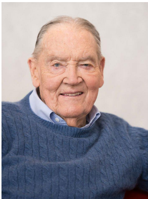
JOHN C. BOGLE

John Bogle (1929-2019) основал компанию Vanguard в 70-е годы, предоставив людям возможность пассивного инвестирования сбережений с минимальными издержками.