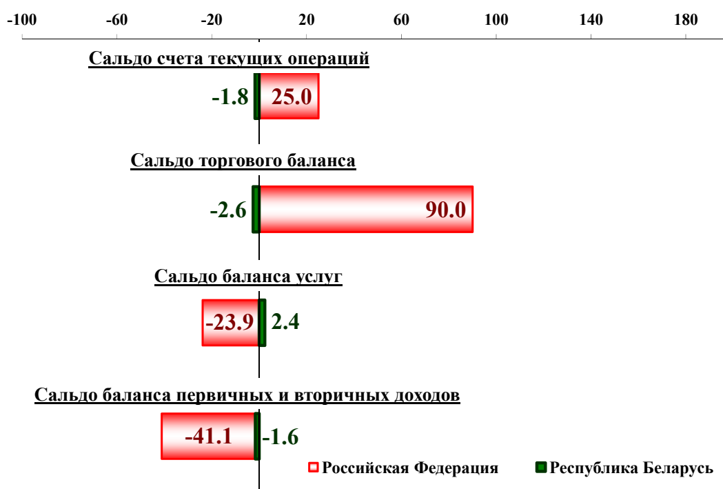
Счет текущих операций и его основные компоненты в 2016 году (млрд долларов США)

Положительное сальдо счета текущих операций сводного платежного баланса сократилось относительно 2015 года до 23,2 млрд долларов США, или на 43,9 млрд долларов США. Динамика сальдо счета текущих операций Союзного государства сформирована прежде всего снижением положительного итога внешней торговли, которое не было компенсировано уменьшением дефицита баланса услуг и баланса первичных доходов.