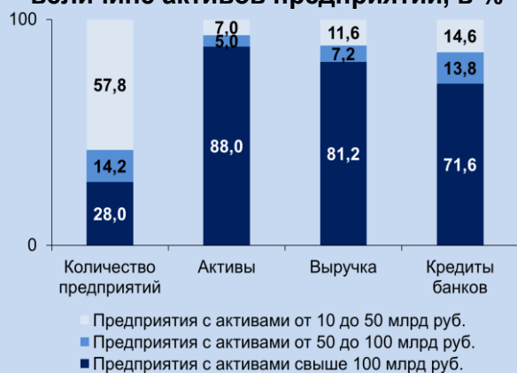
Распределение сводных показателей по величине активов предприятий, в %