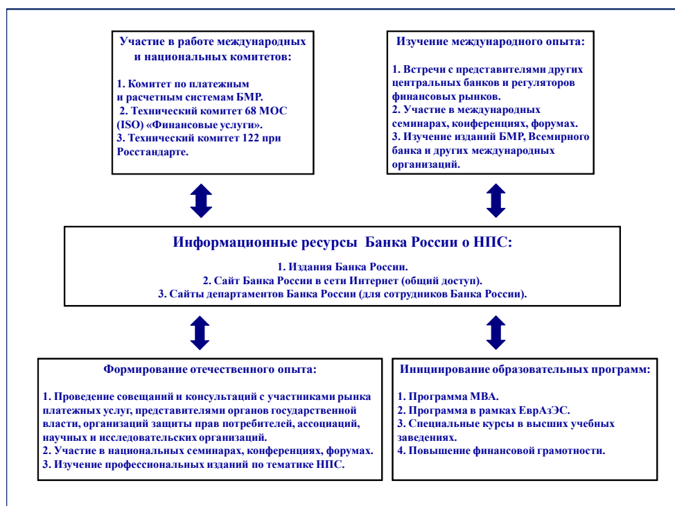
Рис. 4. Общая схема формирования и предоставления Банком России информационных ресурсов о НПС

Банком России уже выпущено 29 номеров издания «Платежные и расчетные системы». Выпуски данного издания содержат переводы на русский язык стандартов Комитета по платежным и расчетным системам и Всемирного банка, переводы Директив Европейского союза, переводы отчетов, подготовленных национальными банками, содержащие различного рода методические материалы по тематике платежных систем.