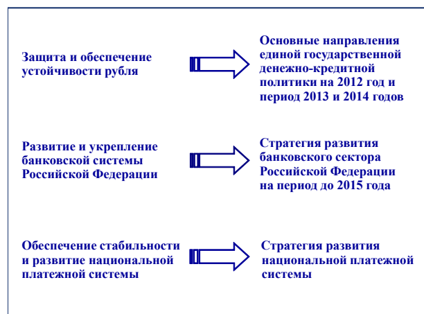
Рис. 1. Цели деятельности Банка России и программные документы

с выполнением функции по установлению правил расчетов в Российской Федерации. Кроме того, Банку России вменена обязанность по разработке и принятию Стратегии развития национальной платежной системы. Таким образом, каждой цели деятельности Банка России в настоящее время будет соответствовать отдельный программный документ (рис. 1).